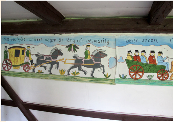
Widebergs trädgård, målning.