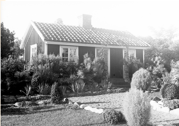
Då: Widebergs hembygdsstuga på 1940-talet.