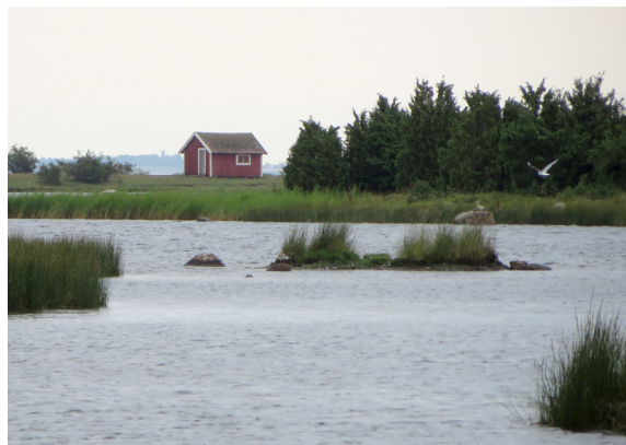
En av sjöbodarna på Örarevet.