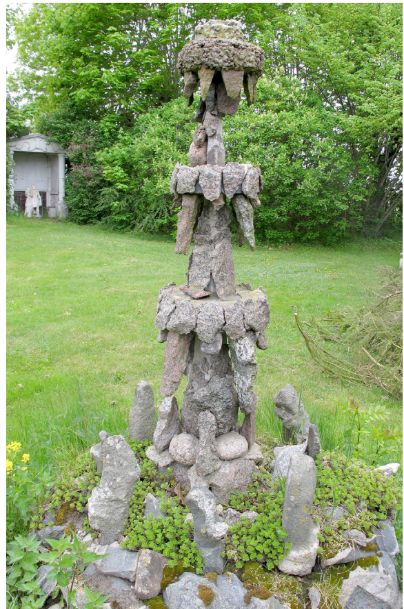
Widebergs trädgård, fontän.