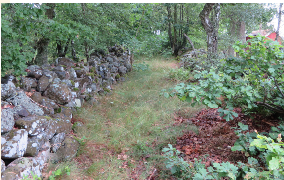
Nu: Nätgården och stenmuren, samma plats idag.