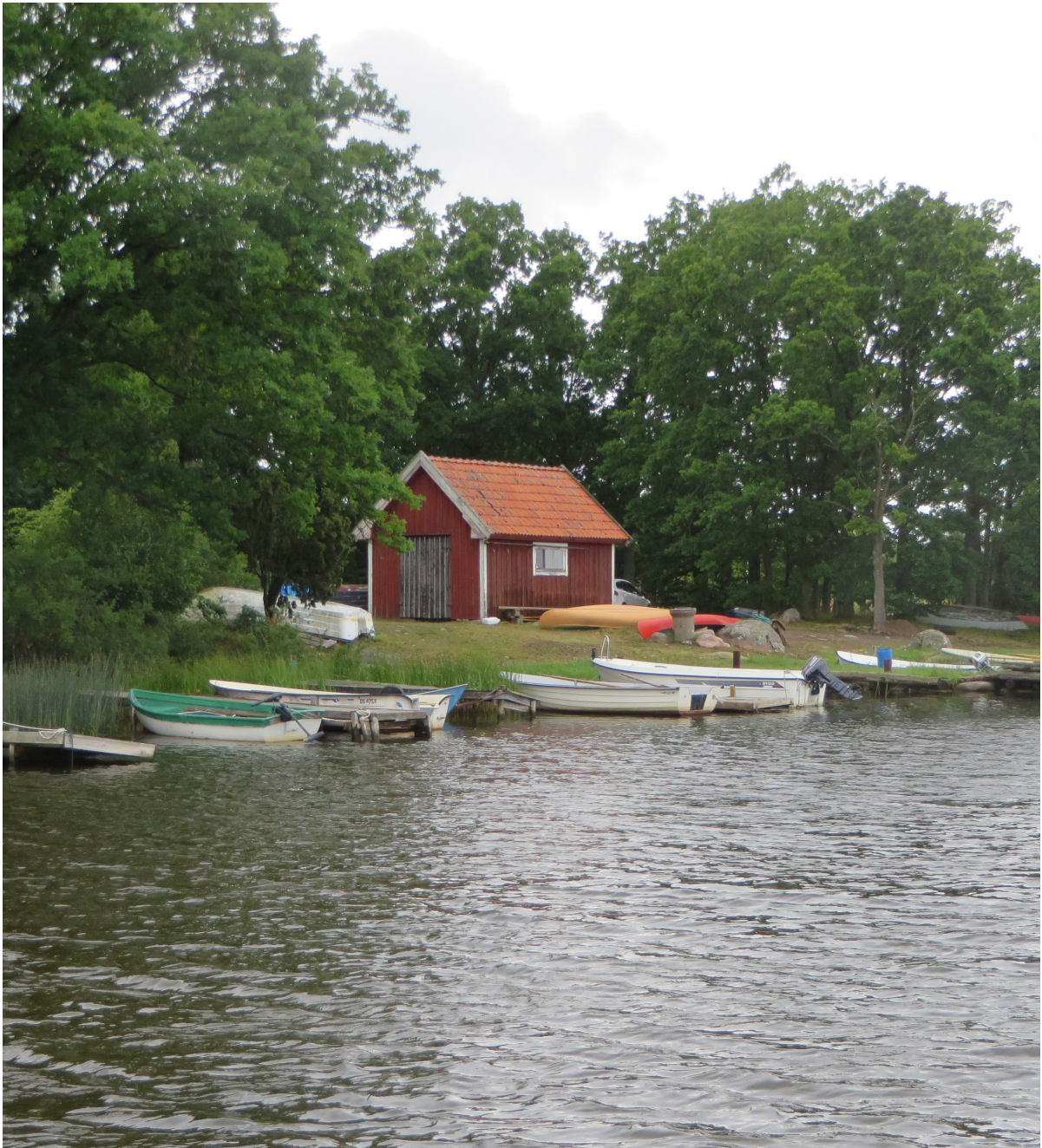
Båtastan från sydost.