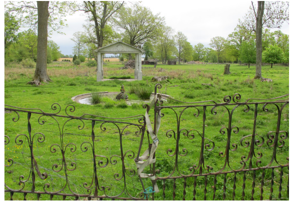
Widebergs trädgård, lusthus i djurhagen.