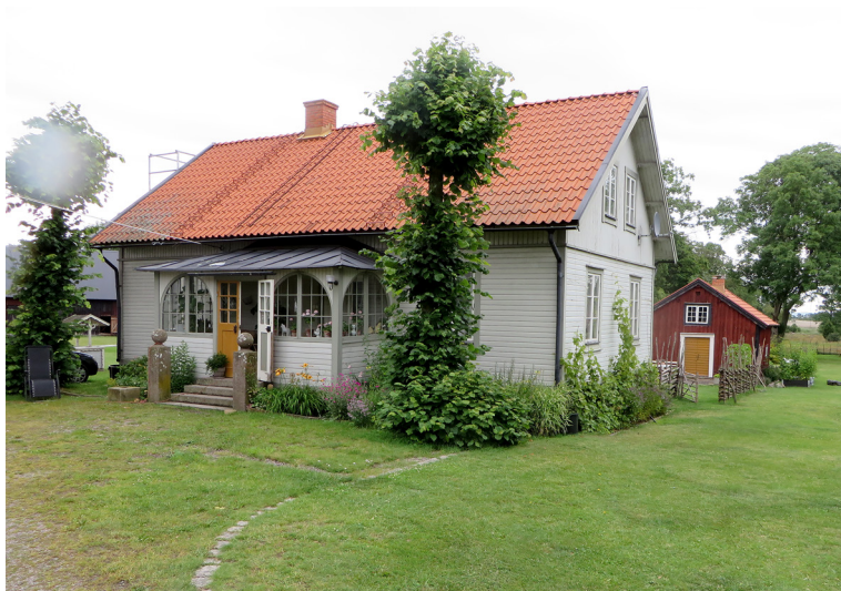
Widebergs trädgård, det lilla bostadshuset (1910) och bryggshuset.