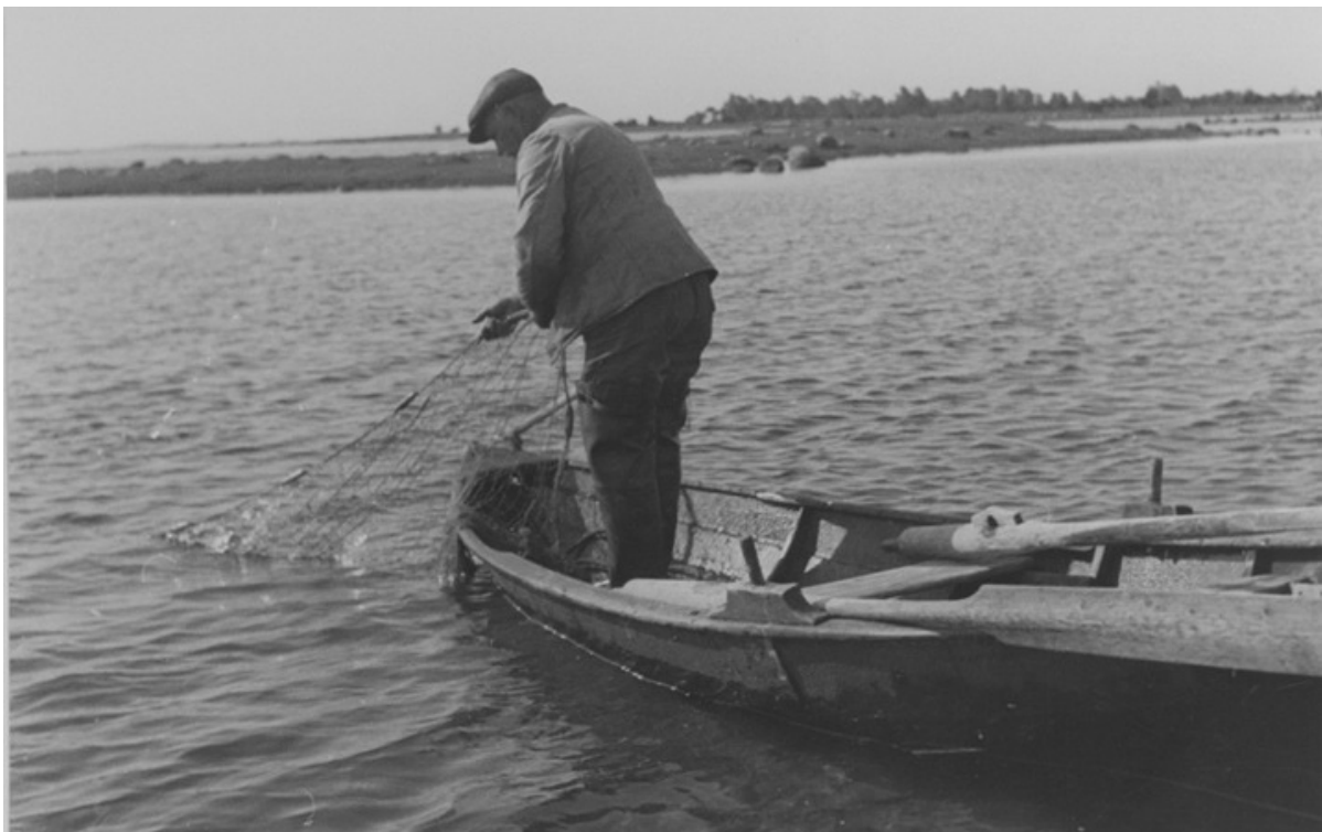
En fiskare i Båtastan, 1936.