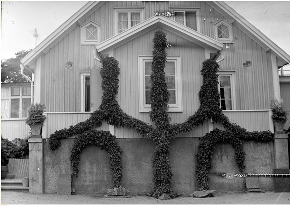
Då: Widebergs mangårdsbyggnad på 1940-talet.