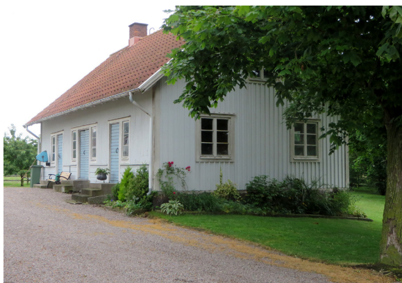
Brygghus, säd- och drängkammare till en gård (Gunnarstorp 5).