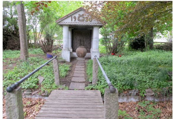
Widebergs trädgård, lusthus.