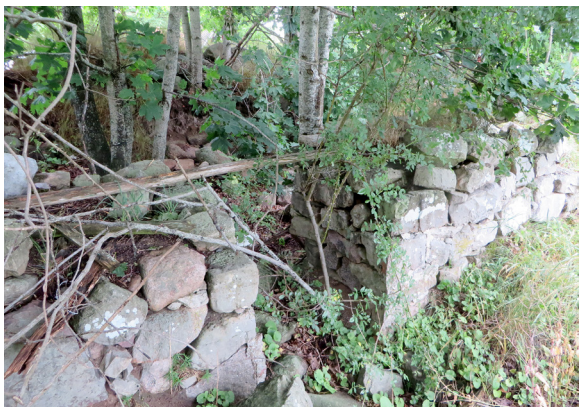
Den stora grunden efter en gemensamt ägd linbasta.