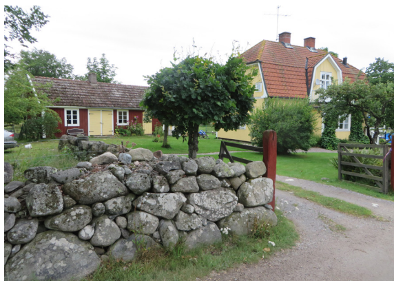
Fiskare Sjögrens villa, i 1910–20-talsstil.