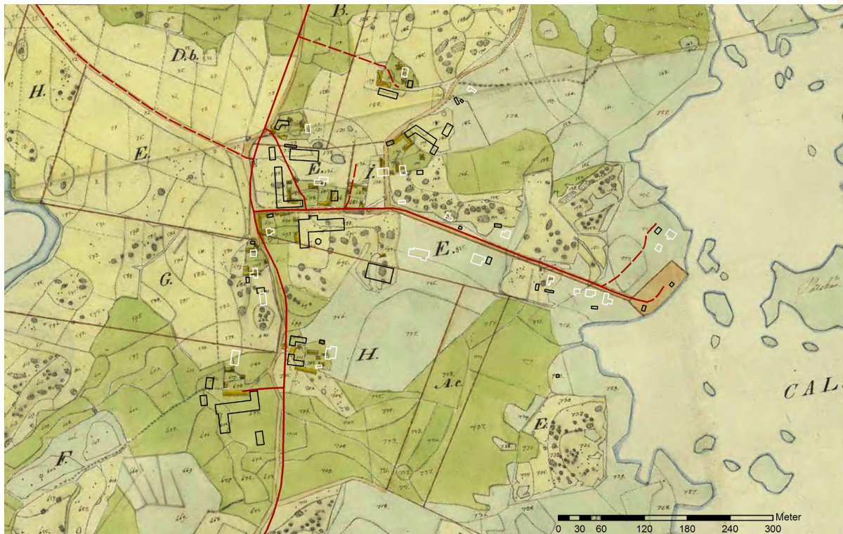
Gunnarstorp, 2017 års karta med vita bostadshus, svarta uthus och röda vägar ovanpå en karta från 1844. De vägar som fanns då är desamma som idag och gårdarna ligger också i samma lägen. Båtastan är markerad som en samfällighet (som ägs gemensamt av bönderna i byn).