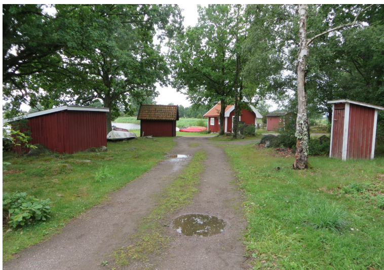
En av de mest intressanta platserna i Gunnarstorp är den lilla hamnen Båtastan. Här syns flera sjöbodar och förvaringsbodar och ett utedass.