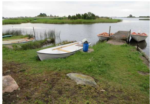
Nu: Båtastan idag, samma vy.