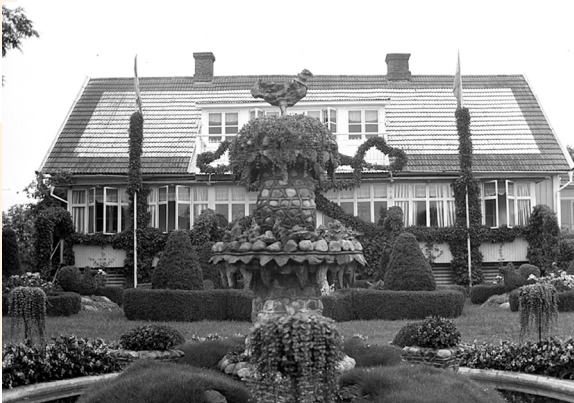
Då: Widebergs trädgård och mangårdsbyggnad på 1940-talet.