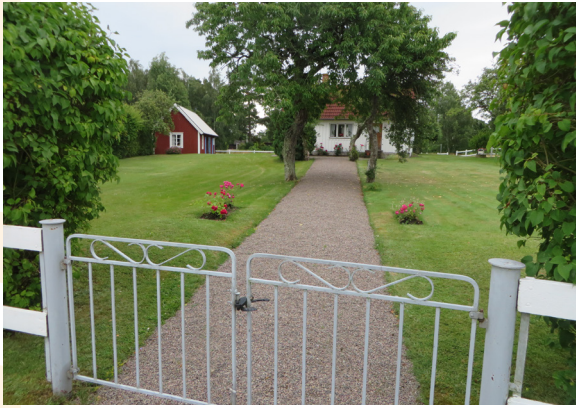
Ett av de små ställen som finns utmed Fulviksvägen, "Peterborg" (Gunnarstorp 9). Trädgård, grusgång och staket med grind är viktigt i miljön.