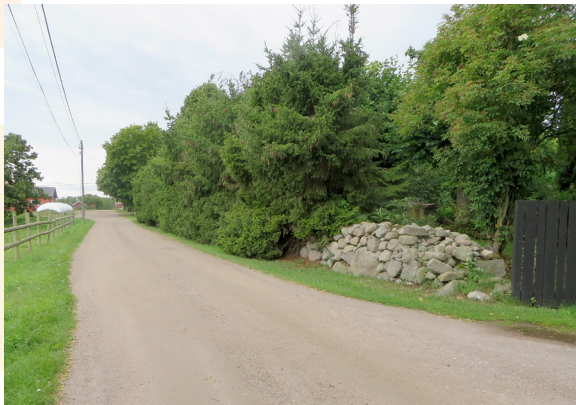
Widebergs trädgård, granhäcken.