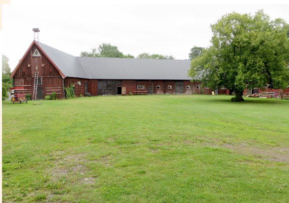
Widebergs trädgård, ladugården.