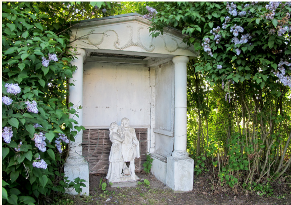
Widebergs trädgård, lusthus.