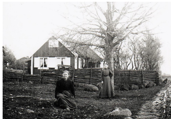
Båtsman Roligs stuga i Fulvik.