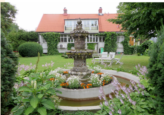
Nu: Widebergs trädgård och mangårdsbyggnad.