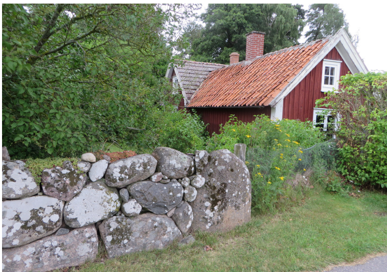
Ett av husen på fiskare Carl Sjögrens lilla gård, utmed Fulviksvägen. Äldre bevarade tegeltak och stenvägar bidrar till platsens karaktär.