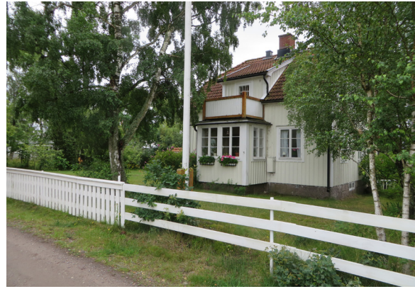
Fiskare Gösta Anderssons villa, av typen 1920-tal.