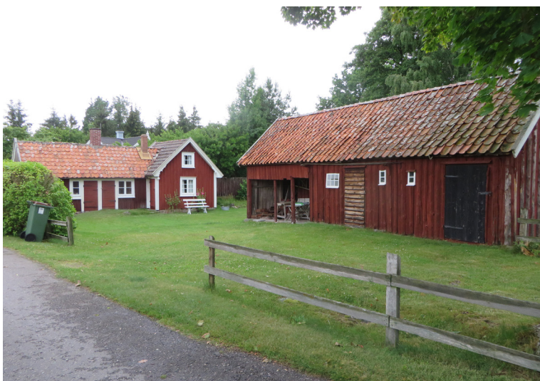
Fiskare Carl Sjögrens lilla gård, utmed Fulviksvägen, med bevarad ladugård/uthus.