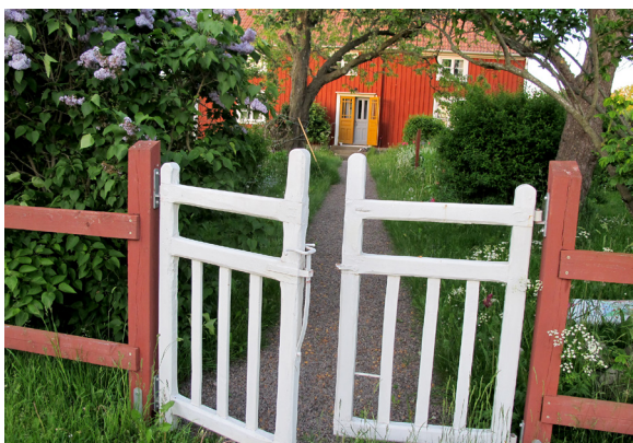
En av byns välbevarade mangårdsbyggnader (Gunnarstorp 2).