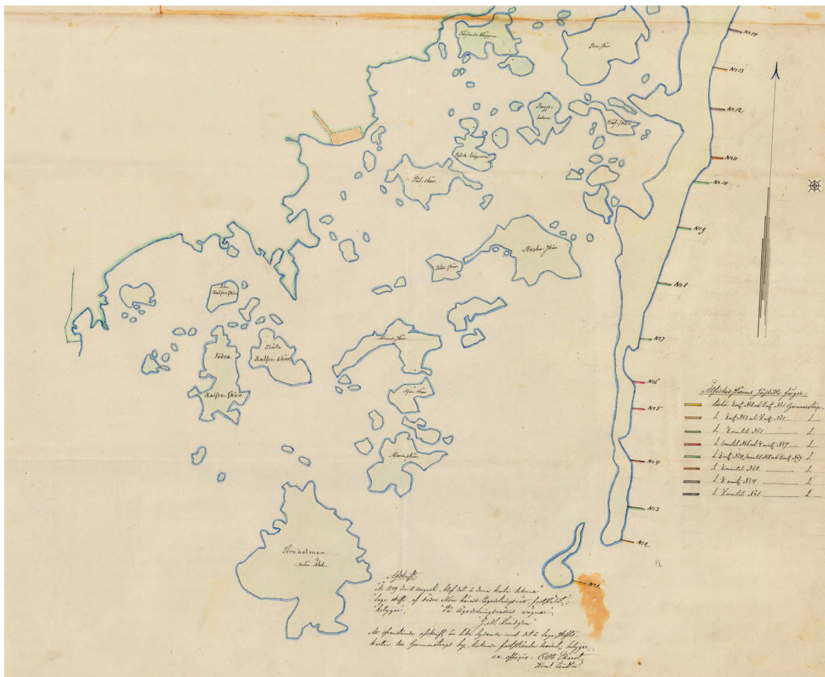
Gunnarstorp fisket, karta från 1892. Alla gårdar i byn hade egna ålfiskeställen, numrerade från 1-9, utmed hela Örarevet.