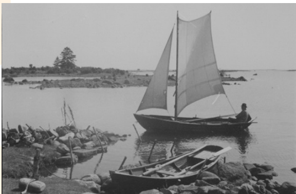
Då: Båtastan på 1930-talet.