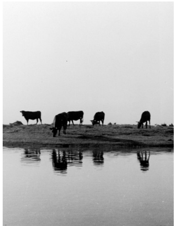
Då: Öarna utanför Gunnarstorp har betats varje sommar under mycket lång tid. Här bild från 1936. Det finns ännu särskilda vadställen där korna kan komma ut till de olika öarna som fungerat som sommarbete. Fåren har körts ut till sina öar med båt.