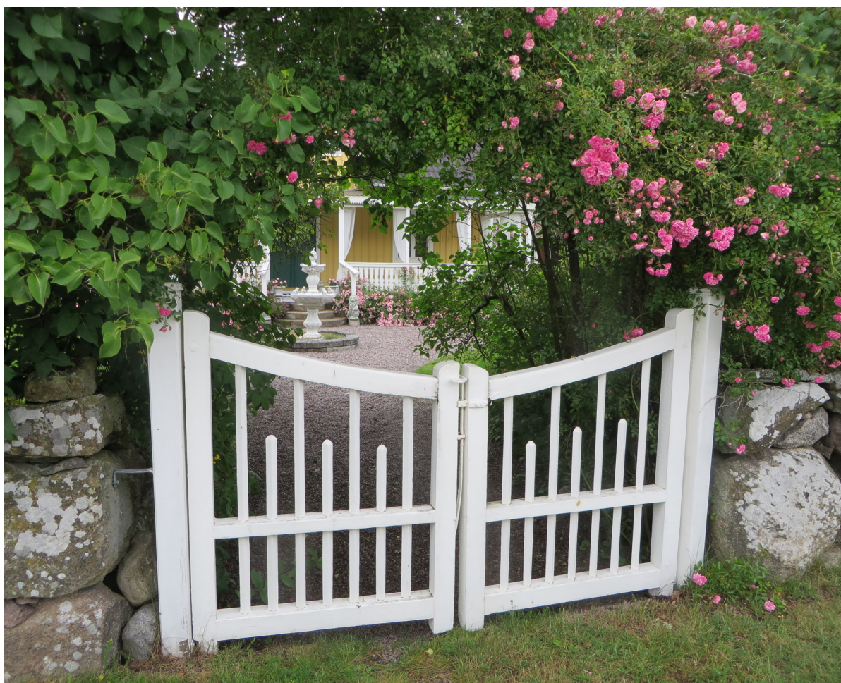
En vacker trägrind utmed den gamla vägen mot Fulvik.

I byns sydvästra del ligger gården Ekskogen (Gunnarstorp 6), uppkallad efter den gamla ekskog som funnits där, varav en del av beståndet finns kvar 15 . Mangårdsbyggnaden är pampig och har stor fruktträdgård. Till gården hör också stora ekonomibygnader, liggande i en egen enhet. Att gården tidigare var sjökaptensboställe märks i dess storlek och högre ståndskarakter. Sjökapten Nygren ska enligt uppgift ha skeppat hit huset från Bergkvara i mitten av 1800-talet. Mitt emot Ekskogen finns en gård (Gunnarstorp 8) som har formen av