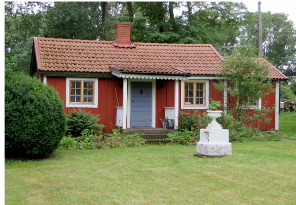
Nu: Widebergs hembygdsstuga.