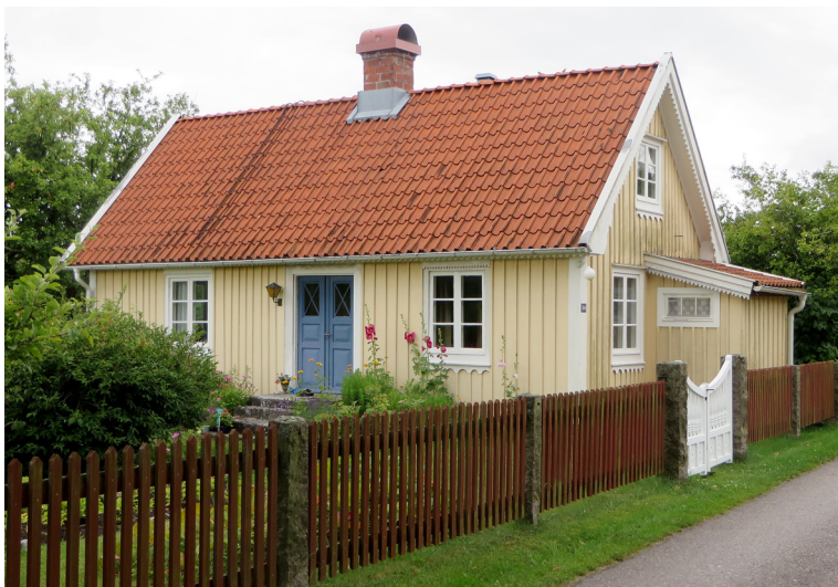
En liten, mycket välbevarad mangårdsbyggnad till en gård, tidigare fiskare Karl Sjögrens, utmed Fulviksvägen.