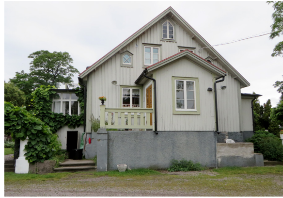
Nu: Widebergs mangårdsbyggnad.