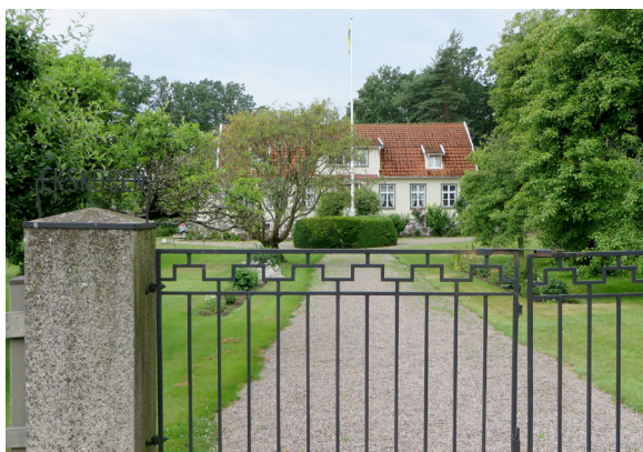
Ekskogen (Gunnarstorp 6).