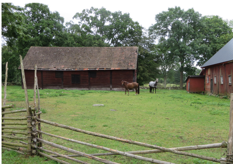
Widebergs gård, ekonomibygnader.