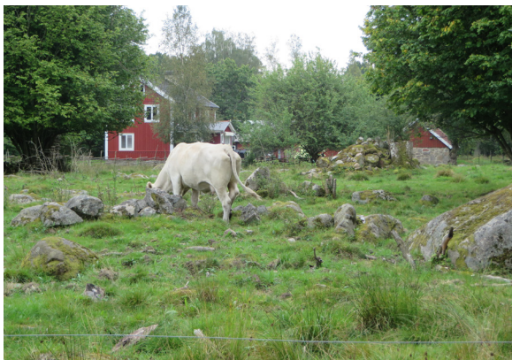
Odlingslandskap med mycket sten.