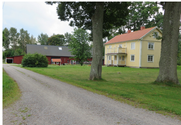
En gård med en äldre ombyggd mangårdsbyggnad.