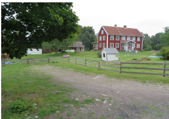
En av Kallemålas mangårdsbyggnader, med framkammarslugans karaktär.