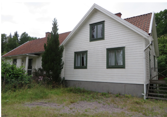
Alldeles intill den gamla häradsvägen finns detta tidigare affärs- och bostadshus.