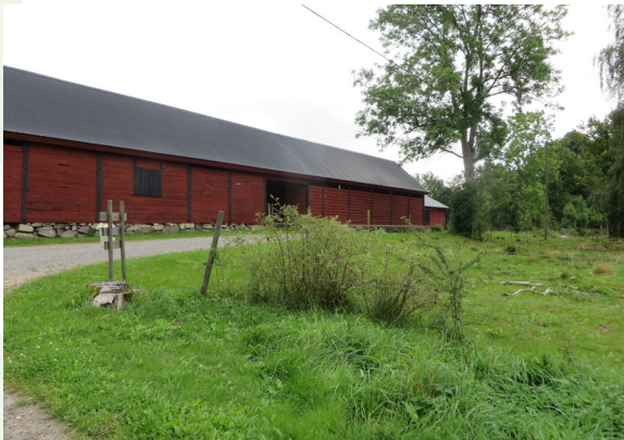
Ladugård bygd i skiftesverk, tidigt 1900-tal.