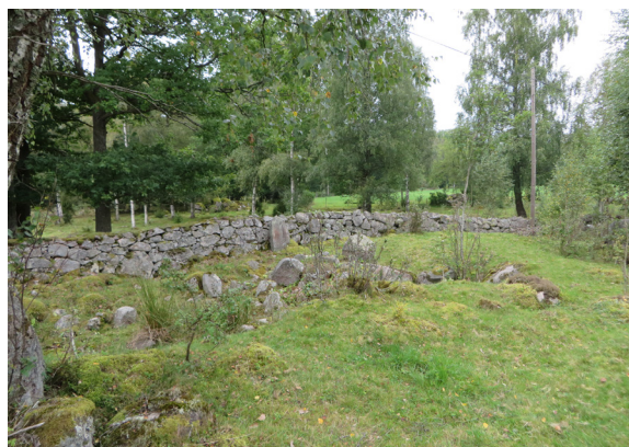
Åkrar, stenmurar från 1800-talet och stenig ängsmark.