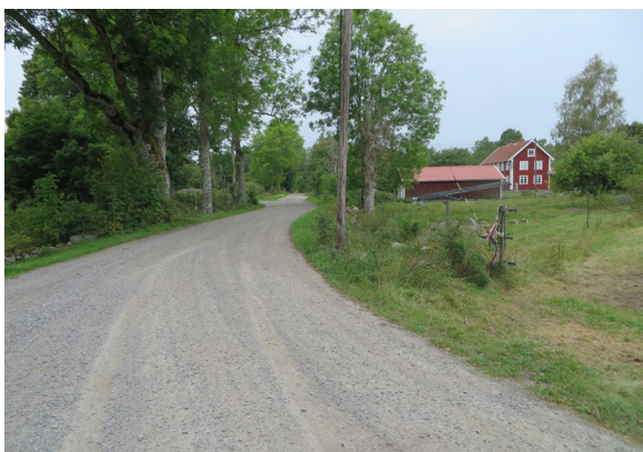
Grusväg och hamlade askar.