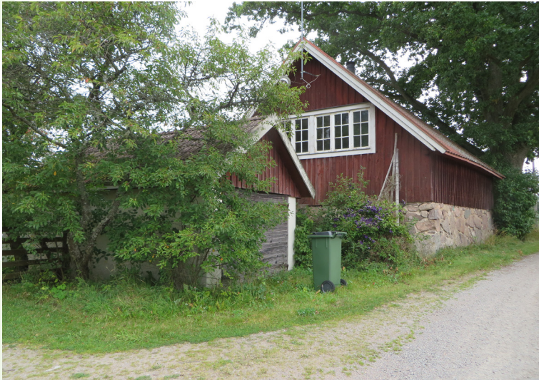
Källarbod och garage.