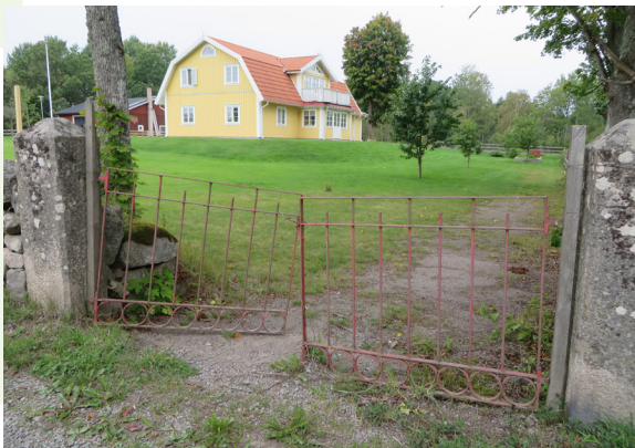
En nybyggd mangårdsbyggnad, på en äldre tomt med äldre stenstolpar och smidd grind.