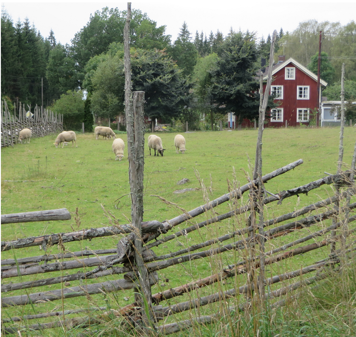
Gärdesgård omgärdar en äldre åker, som idag hålls öppen genom bete.