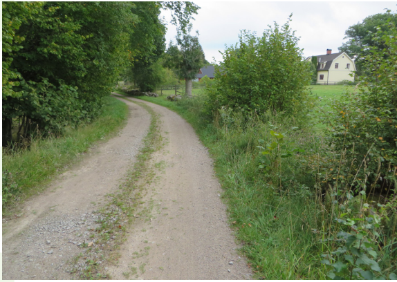
De smala grusbelagda vägarna i byn bidrar till det traditionella landskapet