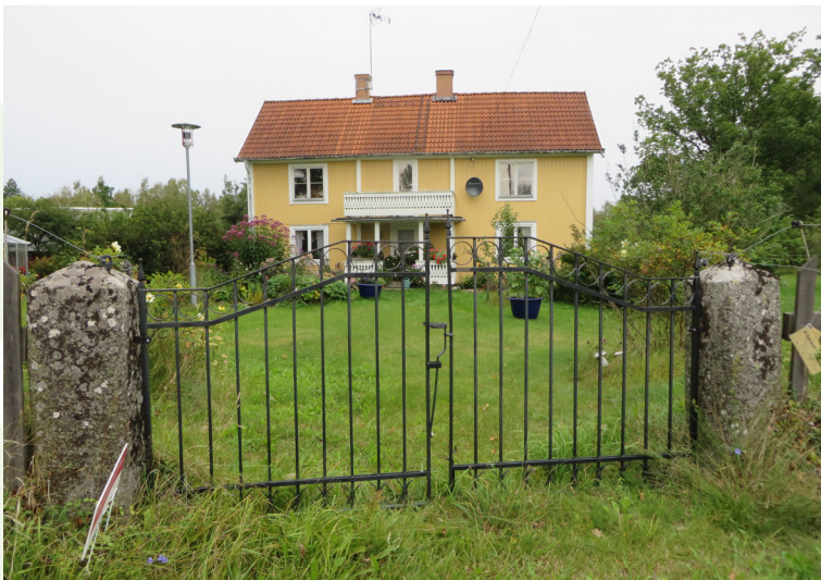
Mangårdsbyggnad med smidd grind.