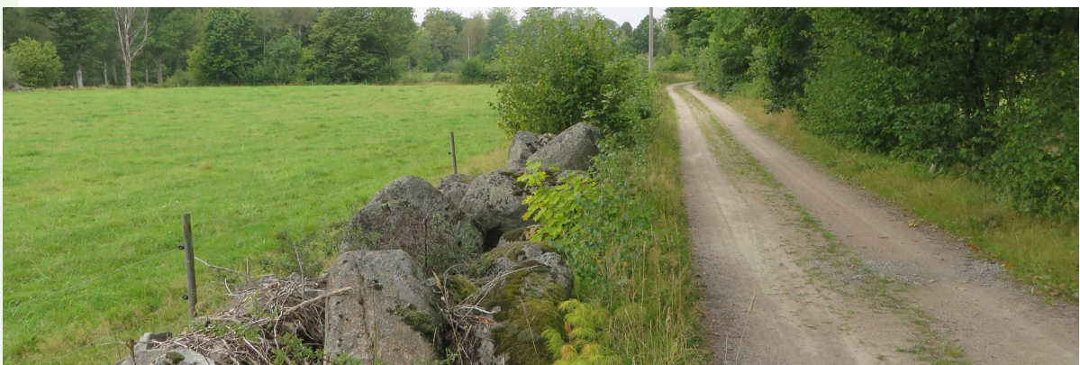
Gammal åkermark intill grusväg.