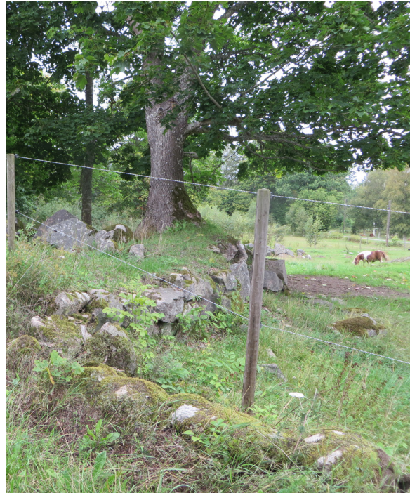
De gamla åkrarna i byn är viktiga för karaktären, men impedimenten mellan åkrarna har också höga värden, både kulturhistoriskt och biologiskt. Här kan finnas växter och djur av stort värde, men också lämningar i sten efter gångna tiders levnadsvillkor. Här kan finnas rester av linugnar, jordkällare, jordkolor, odlingspår, stenrösen eller ibland fornlämningar, som är äldre än 1850..