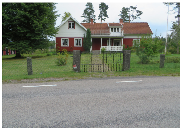
Tidigare affärs- och bostadshus.