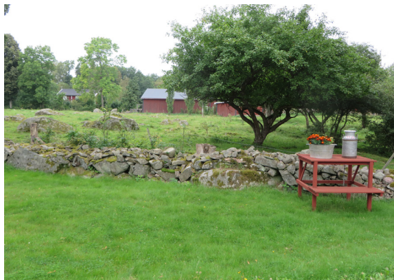
Åkrarna centralt i byn.